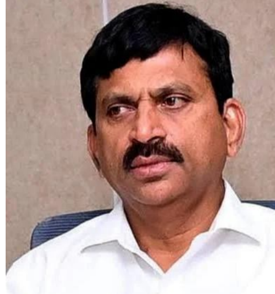
వరకు ఇళ్ల నుంచి ప్రజలు బయటికి రావద్దని మంత్రి పొంగులేటి

హైదరాబాద్, మే 13 : రాష్ట్ర ప్రజలకు మంత్రి పొంగులేటి కీలక హెచ్చరికలు చేశారు. రాష్ట్రంలో రోజూరోజూకూ ఎండలు మండిపోతున్న నేపథ్యంలో ప్రజలు అప్రమత్తంగా ఉండాలని సూచించారు. ఉదయం 8.30 గంటల నుంచి సాయంత్రం 5 గంటల వరకు ప్రజలు బయటకు రావద్దని హితవు పలికారు. కొన్ని జిల్లాల్లో 44 డిగ్రీలకు పైగా ఉష్ణోగ్రతలు నమోదయ్యే అవకాశాలు ఉన్నాయని పేర్కొన్నారు. అన్ని జిల్లాల కలెక్టర్లు అలర్ట్ గా ఉండాలని మంత్రి ఆదేశాలు జారీ చేశారు. తెలంగాణలో భాషి భగభగలు పెరిగిపోతున్నాయి. ఉదయం 8 గంటల తర్వాత ఇంటి నుంచి బయటికి రాలంటేనే జనాలు జంతువులు. భారీగా ఉష్ణోగ్రతలు సహారు కావడంతో.. వడదెబ్బ తగలడం, అస్వస్థతకు గురికావడం వంటి సంఘటనలు పెరిగిపోతున్నాయి. మరోవైపు.. ఎండలు మండిపోతుండటంతో.. జనాలు ఇళ్ల నుంచి బయటికి కాలు పెట్టలేకపోతున్నారు. ఈ క్రమంలోనే రాజీయే రోజుల్లో ఎండలు మరింత తీవ్రంగా ఉంటాయని.. వడగాల్లులు వీచే అవకాశం ఉందని వాతావరణ శాఖ చేసిన హెచ్చరికలతో రాష్ట్ర ప్రభుత్వం అప్రమత్తం అయింది. ఎండల పట్ల రాష్ట్ర ప్రజలు అలర్ట్ గా ఉండాలని తెలంగాణ రెవెన్యూ, వివత్తు నిర్వహణ శాఖ మంత్రి పొంగులేటి శ్రీనివాస్ రెడ్డి తాజాగా కీలక సూచనలు చేశారు. అత్యవసరం అయితే తప్ప.. ఉదయం 8:30 గంటల నుంచి సాయంత్రం 5 గంటల