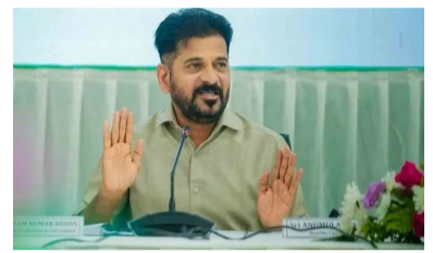
కార్పొరేట్ ఆఫీసర్ నిర్మాణానికి ఆసక్తి చూపించారు. పార్కింగ్ వ్యాపారంలోకి వచ్చే అంశాన్ని పరిశీలించాలని ఉబర్ సీఈఓకి సూచించారు ముఖ్యమంత్రి. దేశంలోని ప్రముఖ నగరాల్లో పార్కింగ్ సమస్యను ఉబర్ ప్రతినిధుల దృష్టికి తీసుకువచ్చారు సీఎం. భవిష్యత్తు అవసరాల దృష్ట్యా చీఫ్ లెవల్ పార్కింగ్ సెంటర్లు ఏర్పాటు చేస్తే బాగుంటుందని సూచించారు. సీఎం సూచనలపై సమగ్ర అధ్యయనం చేస్తామని ఉబర్ ప్రతినిధులు తెలిపారు.

హైదరాబాద్, మే 13 : తెలంగాణ ముఖ్యమంత్రి రేవంత్ రెడ్డితో జూబ్లీహిల్స్ నివాసంలో ఉబర్ సంస్థ చీఫ్ ఎగ్జిక్యూటివ్ ఆఫీసర్ దారా ఖోస్లాపాపా ఈరోజు (బుధవారం) సమావేశం అయ్యారు. ఈ భేటీలో పలు కీలక అంశాలపై చర్చించారు. ఈ సమావేశంలో ఉబర్ చీఫ్ బిజినెస్ ఆఫీసర్ మధు కన్నన్, ఉబర్ ఇండియా, సౌత్ ఆసియా ప్రెసిడెంట్ ప్రభాకర్ సింగ్, చీఫ్ టెక్నాలజీ ఆఫీసర్ ప్రవీణ్ నిమ్మిర్ల నాగ, సీఎం ప్రత్యేక కార్యదర్శి అజిత్ రెడ్డి పాల్గొన్నారు. ఉబర్ విస్తరణకు రాష్ట్ర ప్రభుత్వంతో కలిసి ముందుకు సాగుతామని సీఈఓ ఖోస్లాపాపా స్పష్టం చేశారు. హైదరాబాద్లో ఉబర్ సెంటర్ ఆఫ్ ఎక్స్టెన్షన్ ను విస్తరిస్తున్నట్లు సీఎం రేవంత్ రెడ్డికి ఉబర్ సీఈఓ తెలిపారు. అమెరికా వెలుపల ఏర్పాటు చేసిన ఈ మొదటి సెంటర్లో 600 మంది ఇంజనీర్లు పనిచేస్తున్నారని సీఈఓ వివరించారు. భారత్ ఫ్యూచర్ సీటీలో ఉబర్