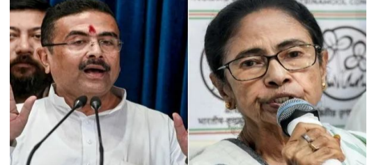
పలు నిర్ణయాలు తీసుకుంటున్నారు. కాగా.. ఇప్పుడు నందిగ్రామ్ తో పాటుగా భవానీపూర్ నుంచి గెలిచిన సువేందు అధికారి.. తాను భవానీ పూర్ ఎమ్మెల్యేగా కొనసాగుతానని.. నందిగ్రామ్ స్థానం కు రాజీనామా చేస్తున్నట్లు ప్రకటించారు. కాగా.. గతంలో మమతా గెలిచిన రెండు నియోజకవర్గాల్లో సువేందు గెలిచారు.

బెంగాల్ : ముఖ్యమంత్రి సువేందు అధికారి సంవలన నిర్ణయం తీసుకున్నారు. తాజా ఎన్నికల్లో డీఎంసీ పైనే బీజేపీ విజయంలో సువేందు కీలక పాత్ర పోషించారు. ముఖ్యమంత్రిగా ప్రమాణ స్వీకారం చేసిన తరువాత వరుసగా ఆసక్తి కర నిర్ణయాలతో ముందుకు వెళ్తున్నారు. మమత రాజకీయ వ్యూహం పై పూర్తి అవగాహన ఉన్న సువేందు.. ఆపరేషన్ డీఎంసీ ప్రారంభించారు. బెంగాల్ ముఖ్యమంత్రి సువేందు మరో కీలక నిర్ణయం వెల్లడించారు. తాజాగా జరిగిన ఎన్నికల్లో డీఎంసీని బీజేపీ ఊహించని దెబ్బ తీసింది. డీఎంసీతో సహా మమతా బెనర్జీని భవానీపూర్ నుంచి ఓడించారు. 2021 ఎన్నికల్లో నందిగ్రామ్ నుంచి మమతను ఓడించిన సువేందు.. తాజా ఎన్నికల్లో భవానీపూర్ లోనూ మమత పై విజయం సాధించారు. ఇక.. సీఎం బాధ్యతలు చేపట్టిన తరువాత డీఎంసీ లక్ష్యంగా