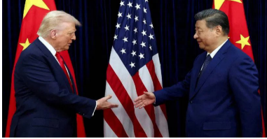
అమెరికా: అధ్యక్షుడు డౌనాల్డ్ ట్రంప్ చైనా చేరుకున్నారు. రాజధాని బీజింగ్లో బుధవారం సాయంత్రం ప్రత్యేక విమానంలో ట్రంప్ చైనా లో అడుగుపెట్టారు. రెండు రోజులపాటు ఆయన చైనాలో పర్యటించనున్నారు. ఈ సందర్భంగా చైనా అధ్యక్షుడు జిన్ పింగ్ తో భేటీ అవుతారు. ఇరు దేశాల మధ్య ద్వైపాక్షిక సంబంధాలపై చర్చించనున్నారు. ఒకవకట్ల ఇరాన్ తో కూడా సాగుతున్న వేగ అమెరికా అధ్యక్షుడు

ట్రంప్.. చైనాలో పర్యటించడం ప్రాధాన్యం సంతరించుకుంది. ట్రంప్ అధ్యక్ష హోదాలో చైనాలో పర్యటించడం ఇది రెండోసారి. చివరగా ఆయన 2017లో చైనాలో పర్యటించారు. ఈ పర్యటనలో భాగంగా చైనా--అమెరికా మధ్య కీలక అంశాలపై చర్చలు, ఒప్పందాలు జరగనున్నాయి. వ్యాపారం, వాణిజ్యం, టెక్నాలజీ, సైనిక, కర్షణ అంశాలతోపాటు తైవాన్ అంశంపై చర్చలు చర్చించే అవకాశం ఉంది. అలాగే, స్నేక్ బాంక్వెస్ట్, డీ రిస్పెన్స్ వంటి కార్యక్రమాలకు కూడా ట్రంప్ హాజరవుతారు. చైనా, అమెరికా ప్రపంచంలోనే రెండు పెద్ద ఆర్థిక వ్యవస్థలు కలిగిన దేశాలు. ఇరు దేశాల మధ్య అనేక అంశాల్లో సహకారంతోపాటు, పలు అంశాల్లో విభేదాలు కూడా ఉన్నాయి. ఈ నేపథ్యంలోనే ట్రంప్ పంట్లనుకు ముందు ప్రకటన జారీ చేసింది.