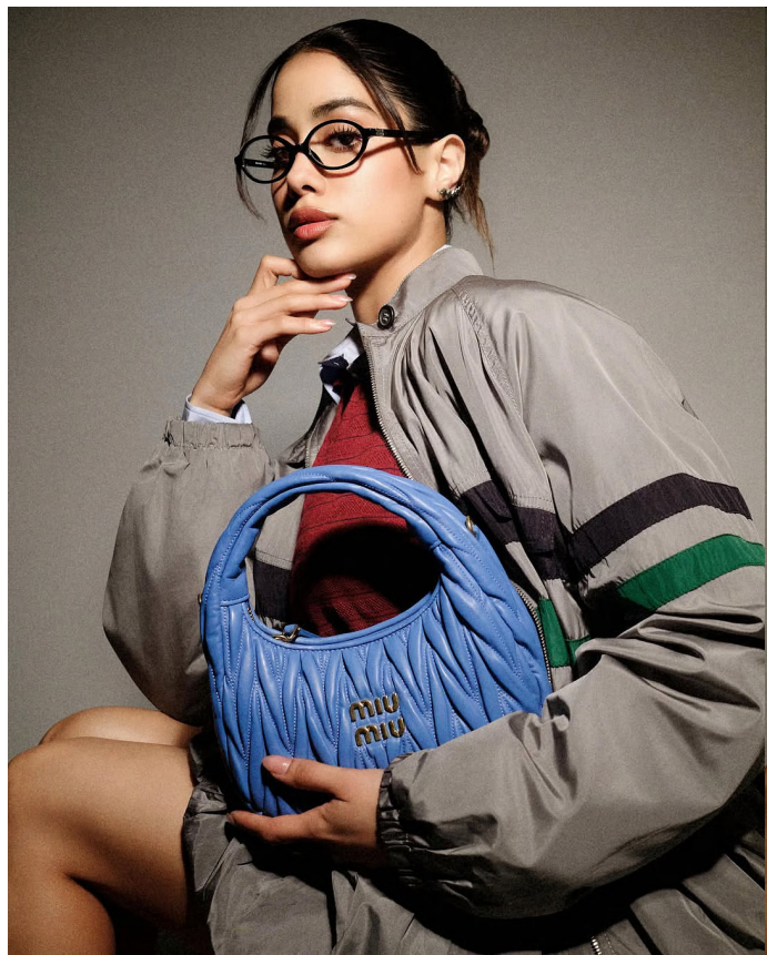
Bollywood actress Janhvi Kapoor attended the launch of EKTRA Jewels by Ekta Kapoor and Susanne Khan in Mumbai wearing a head-to-toe Miu Miu ensemble. The actress

layered a burgundy knit over a blue shirt and paired it with a grey jacket and matching bubble-hem skirt. Styled with a designer bag, sunglasses, and sleek bun, her look blended sporty chic with luxury fashion. Janhvi Kapoor's fashion streak during the promotions of Peddi has been nothing short of impressive, but the actress recently switched gears from dreamy ethnic wear to high-fashion luxury dressing. Attending the launch of EKTRA Jewels by Ekta Kapoor and Susanne Khan in Mumbai, Janhvi arrived in a head-to-toe Miu Miu ensemble that perfectly blended preppy sophistication with sporty edge. For the occasion, Janhvi leaned into Miu Miu's signature playful-meets-polished aesthetic. She started with a crisp blue poplin shirt as the base layer, adding a rich burgundy V-neck cotton knit sweater over it. Taking the look up a notch, she threw on a sporty grey technical silk blouson jacket and completed it with a matching