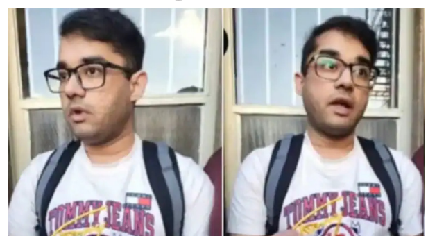
'London: An Indian man has been caught in the United Kingdom while attempting to sexually groom a minor. The troubling incident drew widespread at-