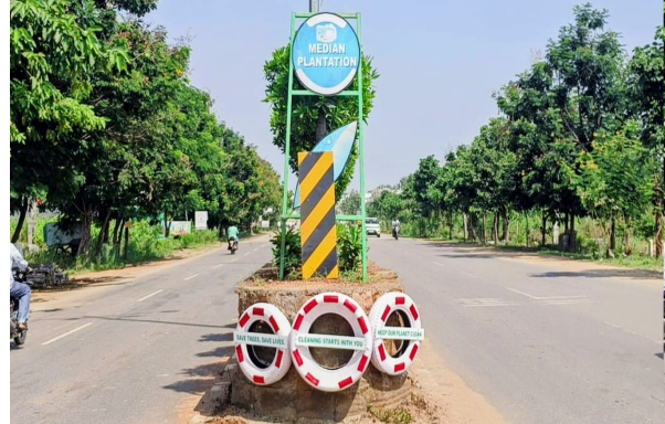
జమ్మికుంట: జమ్మికుంట, నుండి హుజూరాబాద్ వైపుగా వెళ్ళే దారిలో